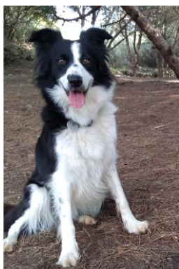
Figure 1: Youkou